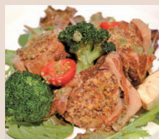
粒マスタードグリル