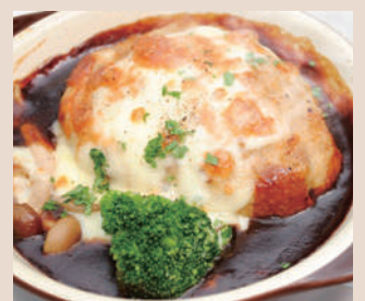
煮込みチーズハンバーグ