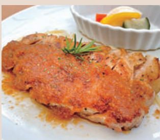
特上ロースステーキ