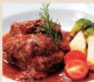
豚スネ肉のトマト煮込み